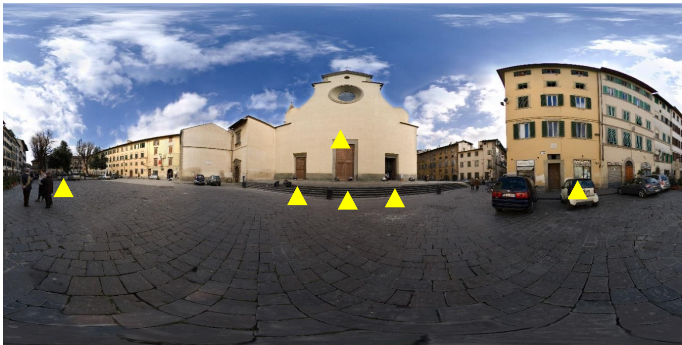
Piazza Santo Spirito Firenze (powyżej), Piazza San Lorenzo (poniżej)