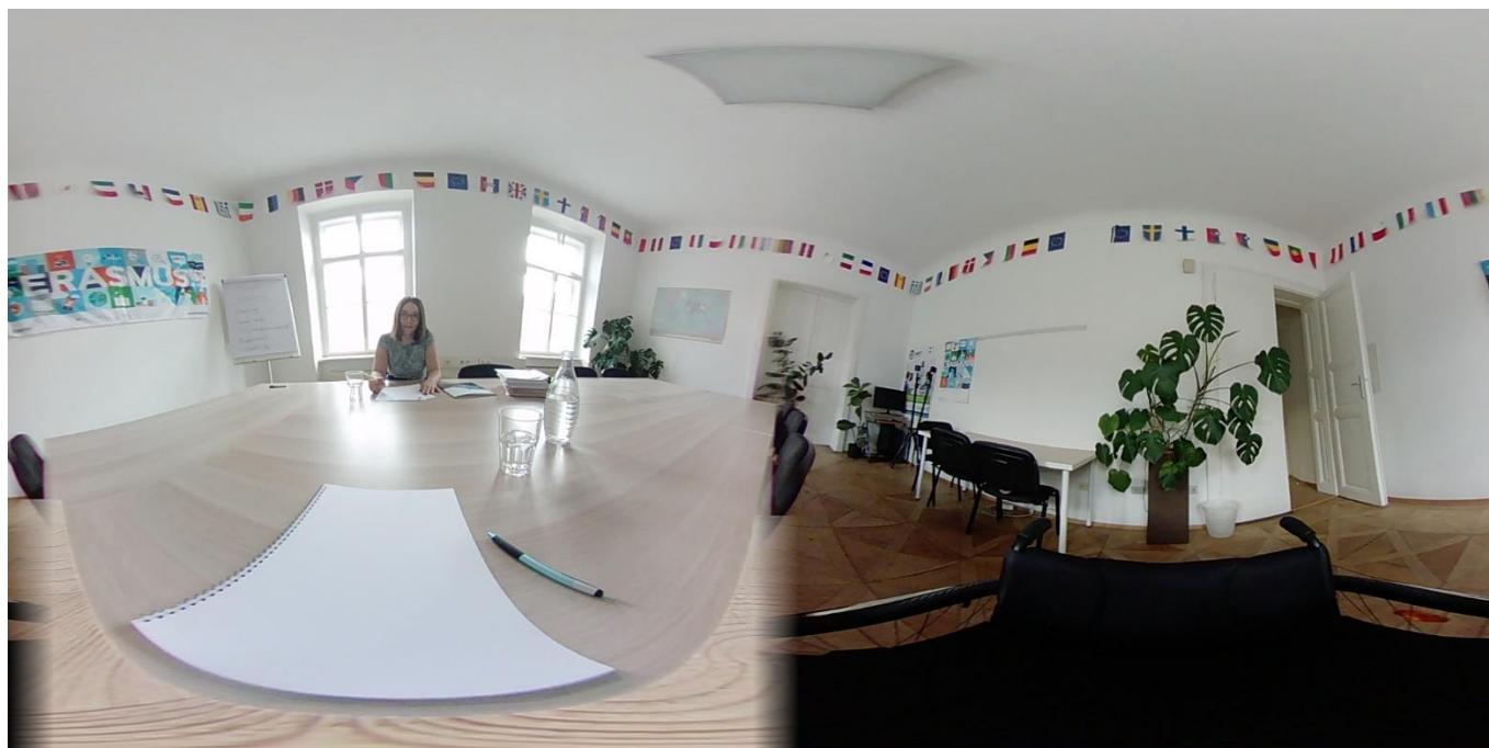
Zdjęcie autorstwa Auxilium