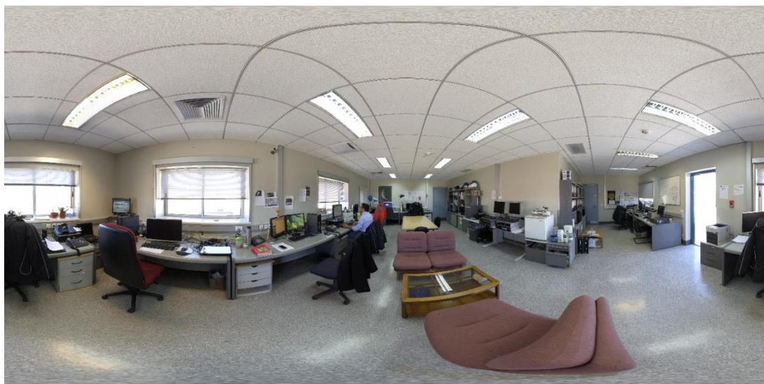
Zdjęcie 1: 3D-360° zdjęcie autorstwa ESO;Below Zdjęcie 2: 3D-360° autor Carlos Chegado ( www.carloschegado.com )

Z kolei obszar po prawej stronie lady umożliwi klientom dostęp do pokoi i do wyższych pięter, jeśli kieruje się na tył pomieszczenia. W przedniej części tej strony znajdują się 4 stanowiska pracy wyposażone w komputery PC, taborety z małym stolikiem oraz szafa pancerna z sejfami, wszystkie dostępne dla klientów. Przy stanowisku pracy siedzi dziewczyna, która z pewnością prowadzi poszukiwania w internecie. Na całej ścianie stoi tablica ogłoszeń pełna informacji, depesz, wycieczek, rozkładów jazdy, programów. W kącie obok dziewczyny stoi automatyczny dystrybutor wody (w butelkach) oraz stojak podtrzymujący duży panel, na którym umieszczane są codzienne informacje.